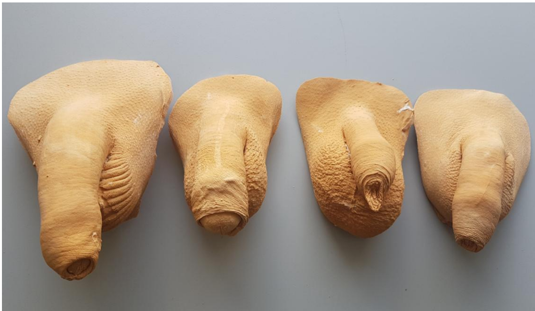
Forskellige modeller i gips

Hvis man aldrig tidligere har haft en penis, kan det være nok så vanskeligt at bestemme og forestille sig hvordan ens egen penis skal være – derfor har vi et lille katalog af modeller, af afstøbninger fra rigtige, helt almenlige danske penisser i forskellige aldre og størrelser til inspiration og for at lave den del af processen mere håndgribelig. Dette trin kan enten laves med det samme eller efter betænkningstid. Er det patientens første protese vil jeg anbefale lidt betænkningstid. Har patienten før haft protese kan man godt nå det hele i en enkelt seance.