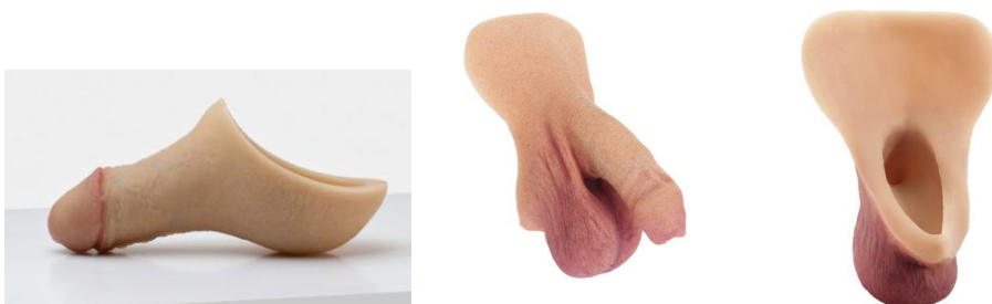
Klassisk STP. For og bagside af kombineret Packer og STP

STP (Stand To Pee) - En STP er er protese du kan urinere gennem. Det kan gøres ved at der er en lille skål der hjælper til at samle urin og lede det gennem et rør ud gennem protesens top – lige som en naturlig penis. STP'er kan også laves i kombination med en packer. Men et godt resultat er her beroende på patientens mobilitet og fysik og teknik.