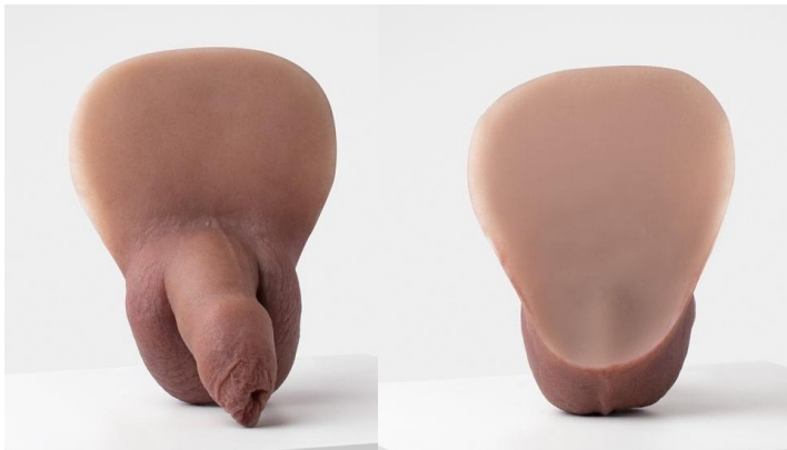
For- og bagside af en packer beregnet for adhesiv.

Packer - En packer er først og fremmest en æstetisk løsning. Det er noget der ligner en penis og giver oplevelsen af ”at have noget i bukserne”.